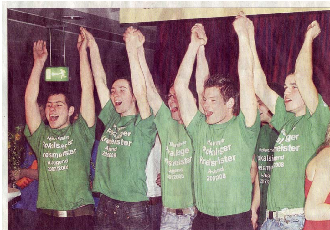
So jubelten die A-Jugend-Fußballer von Grün-Weiß Schwepnitz über ihren Team-Sieg. Sie hatten 202 Stimmen mehr als die jungen Schwimmer des OSSV bekommen. Der OSSV wiederum schaffte fünf Podestplätze.

Bis die Sportler aber auf die Bühne konnten, hatten die fast 40 Helfer des Kreissportbundes Bautzen sowie die Techniker viel Arbeit. „Schon in der Nacht von Freitag auf Sonnabend erfolgte die gesamte Installation“, berichtete KSB-Mitarbeiter Gunthart Symmank, schon früher Koordinator bei Bautzener Galaveranstaltungen. Auf jeden Fall war am Sonnabend um 20 Uhr – nur zwei Stunden nach der Schließung des Kornmarktcenters – alles